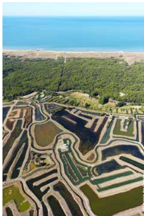
Vue aérienne du site Natura 2000.