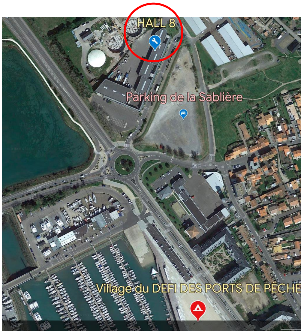
Situation HALL 8 par rapport au Village du DÉFI DES PORTS DE PÊCHE